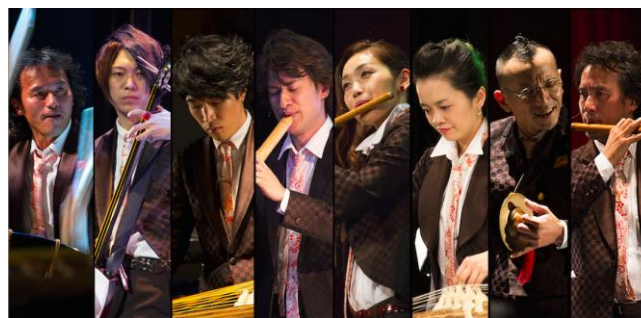
AUN-J CLASSIC ORCHESTRA

ほか俳優・佐野史郎とギタリスト・山本恭司による朗読パフォーマンス等々各種プログラムをご用意しています。