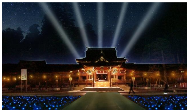
▲画像はイメージ。LEDサーチライトを使った「音と光のショー」は Special Day のみ (11/11～13)